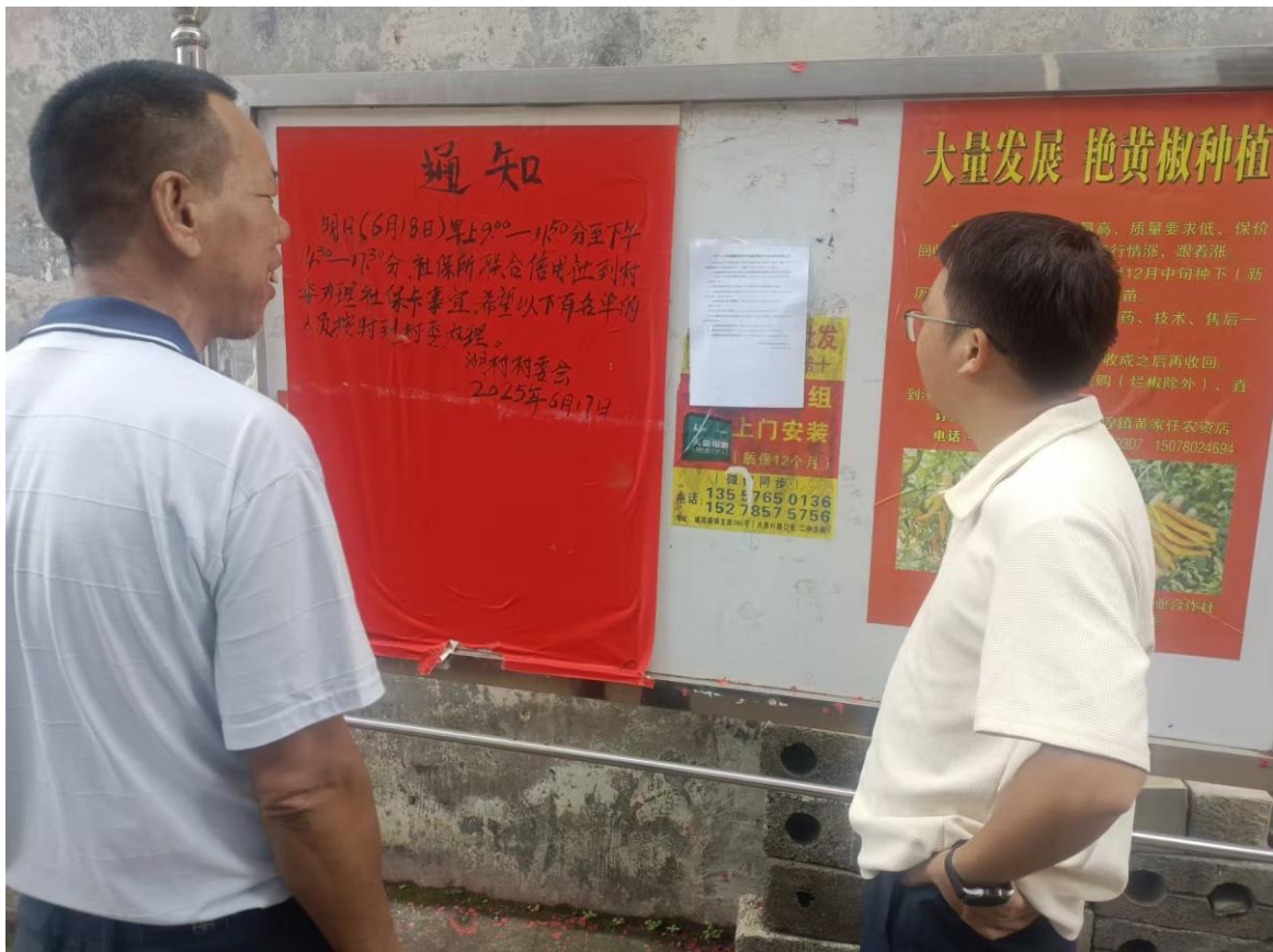
图3.2-7 现场公示照片（湖村）