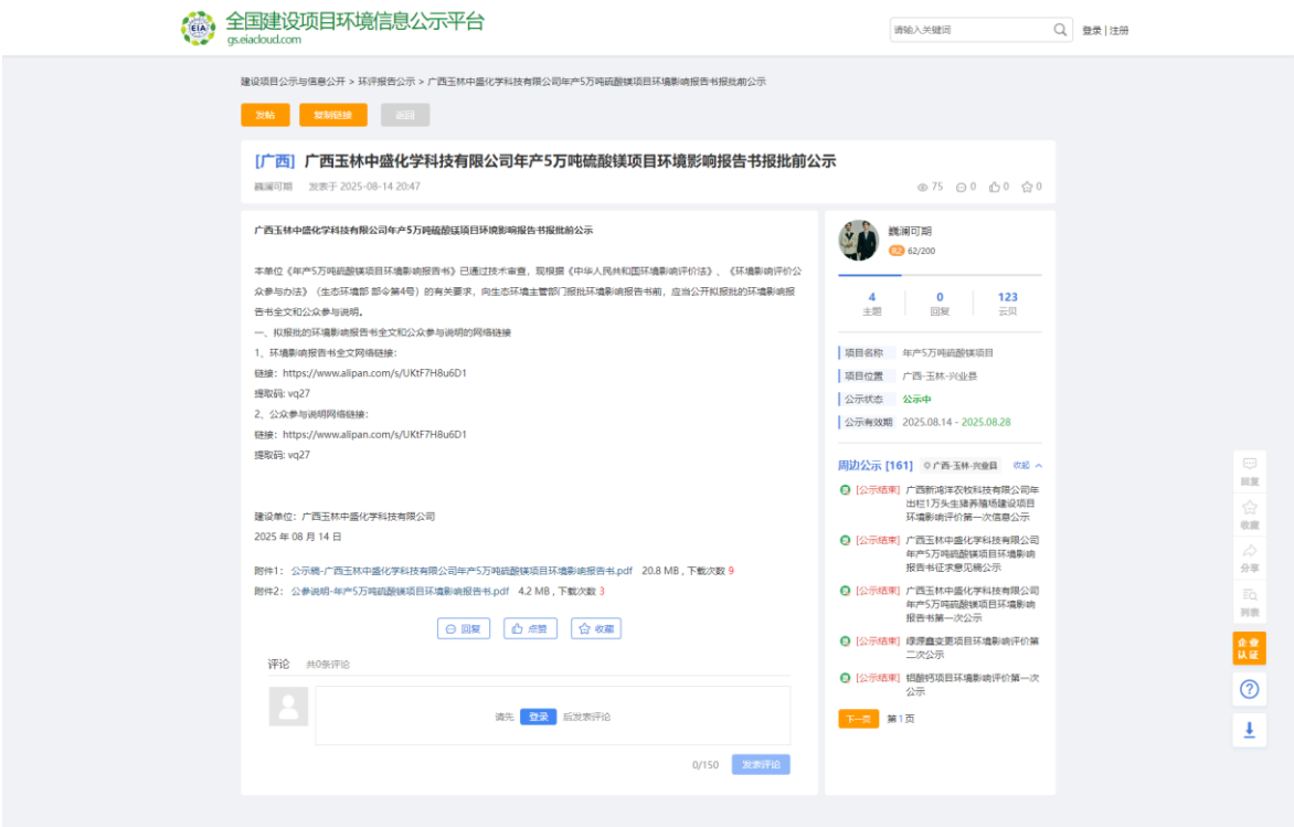
图6.2-1 报批前公示截图