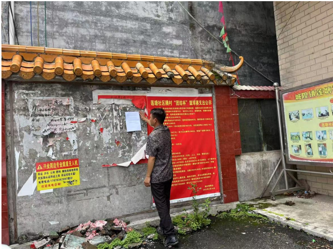
图3.2-11 现场公示照片（莲塘村）