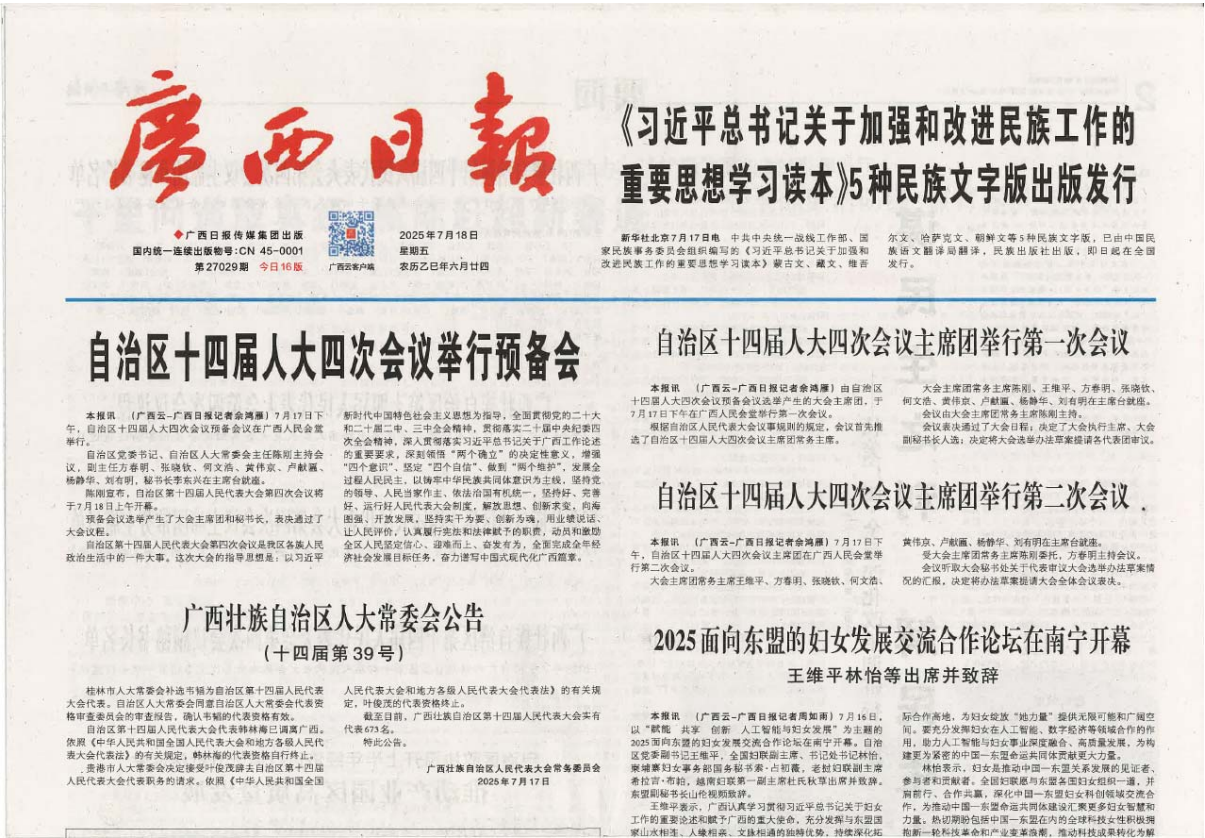
图3.2-3 征求意见公示第二次登报截图