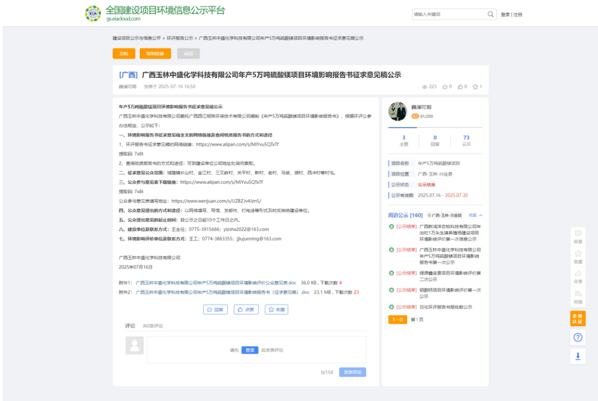
图3.2-1 征求意见稿网络公示截图