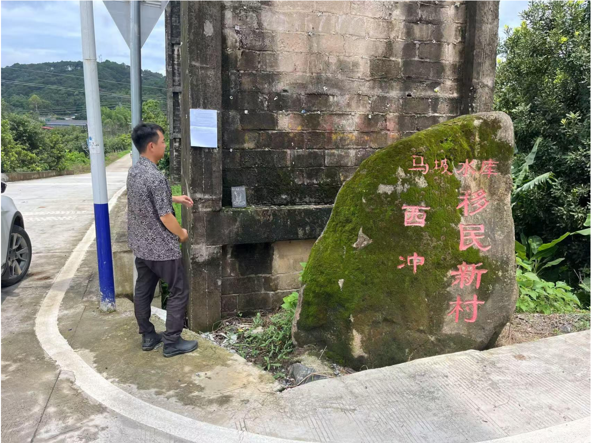
图3.2-8 现场公示照片（西冲村）