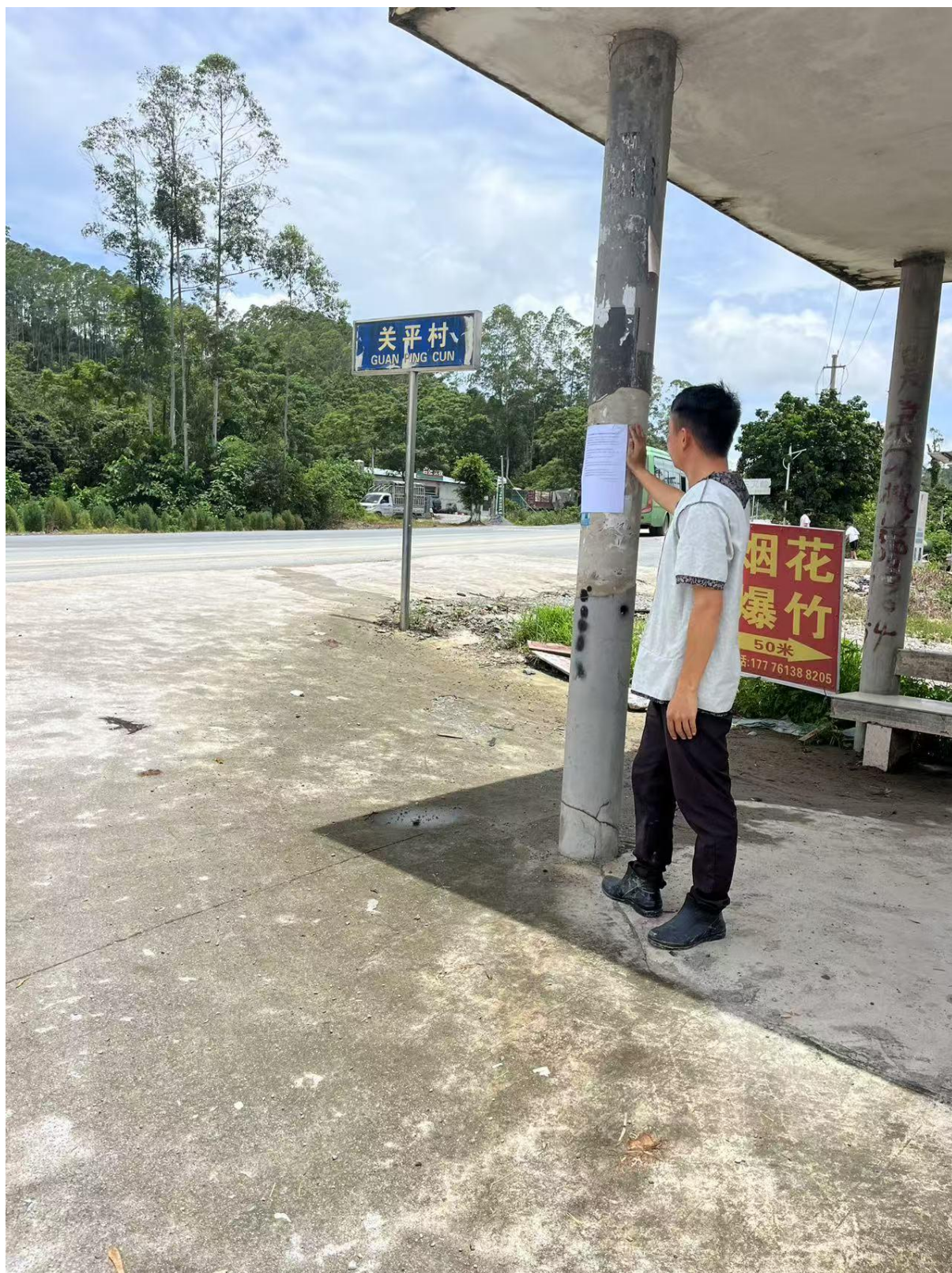
图3.2-9 现场公示照片（关平村）