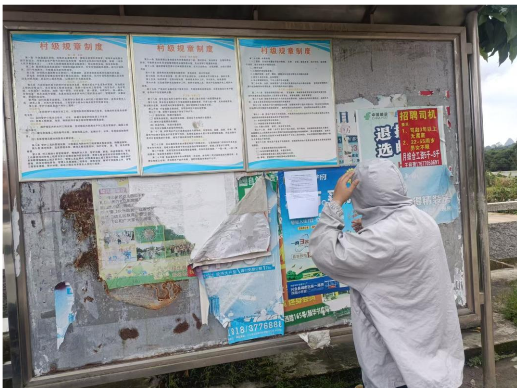
图3.2-5 现场公示照片（长山村）