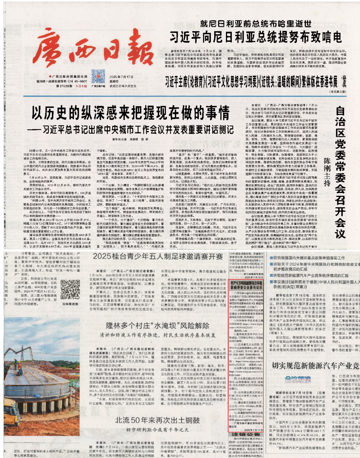
图3.2-2 征求意见公示第一次登报截图

2025年07月17日和2025年07月18日在《广西日报》进行了2次登报公示，《广西日报》为广西壮族自治区玉林市主流的报社，属于建设项目所在地公众易于接触的报纸，符合《环境影响评价公众参与办法》的要求，公示报纸照片见图3.2-2、图3.2-3。