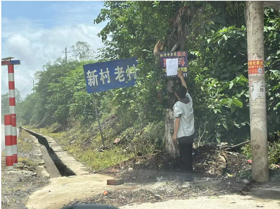
图3.2-6 现场公示照片（新村、老村）