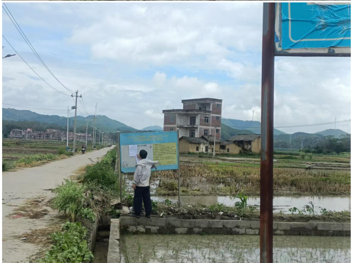
图3.2-10 现场公示照片（金江村）