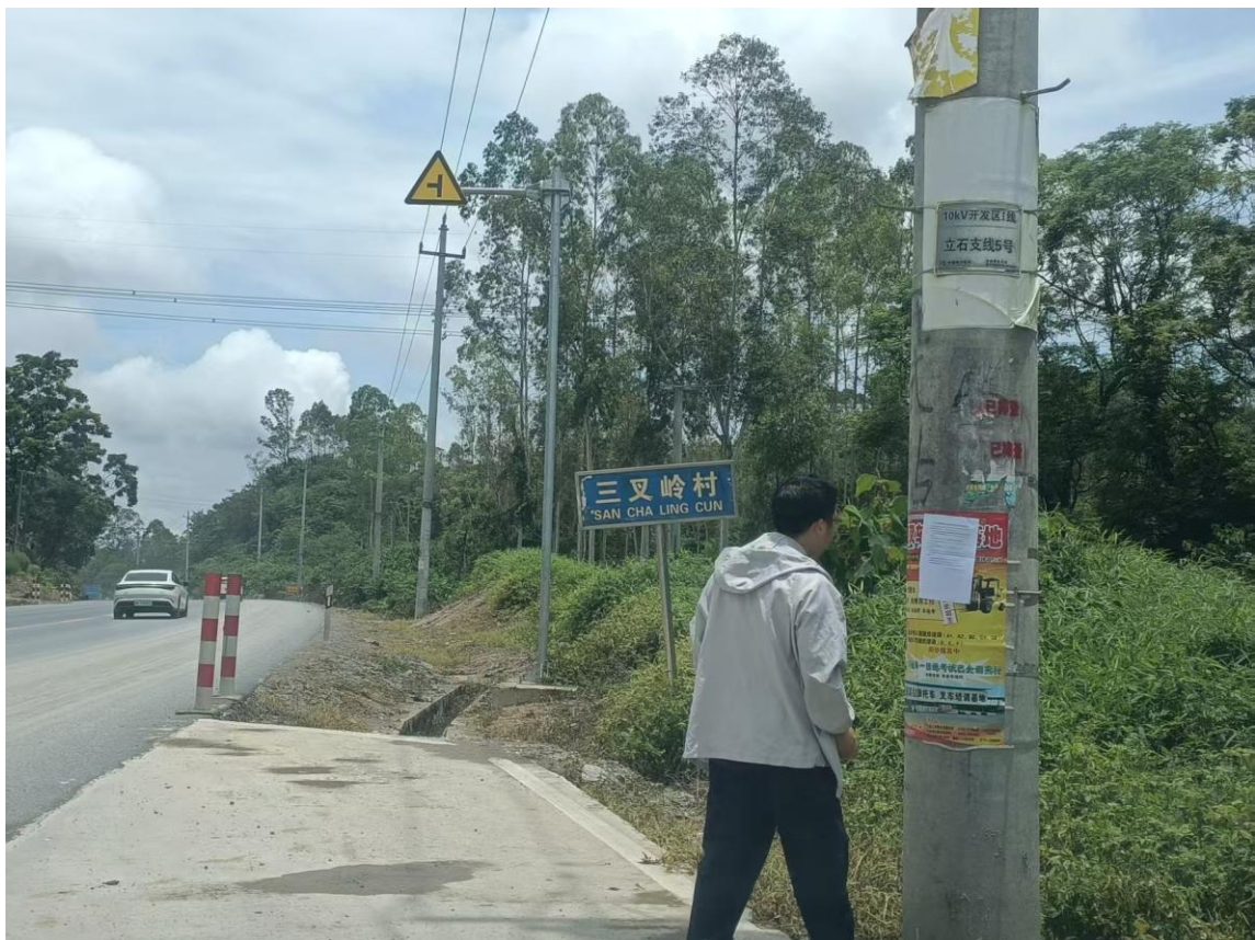
图3.2-12 现场公示照片（三叉岭村）