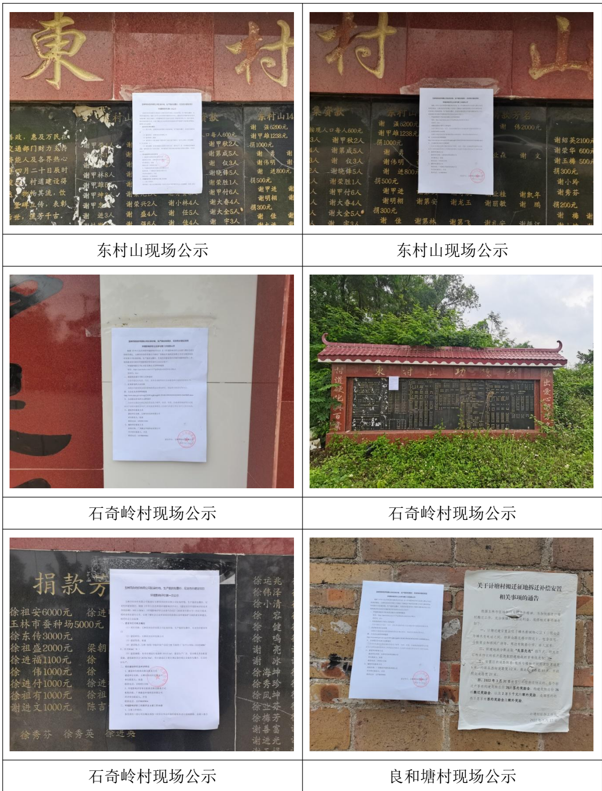
图 3 第二次现场公告