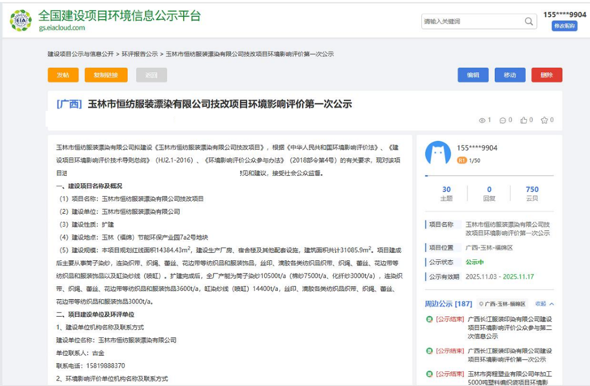
图1 第一次网上公示（全国建设项目环境信息公示平台）

在全国建设项目环境信息公示平台上进行首次公众参与的网上公示，第一次网上公示见图1。