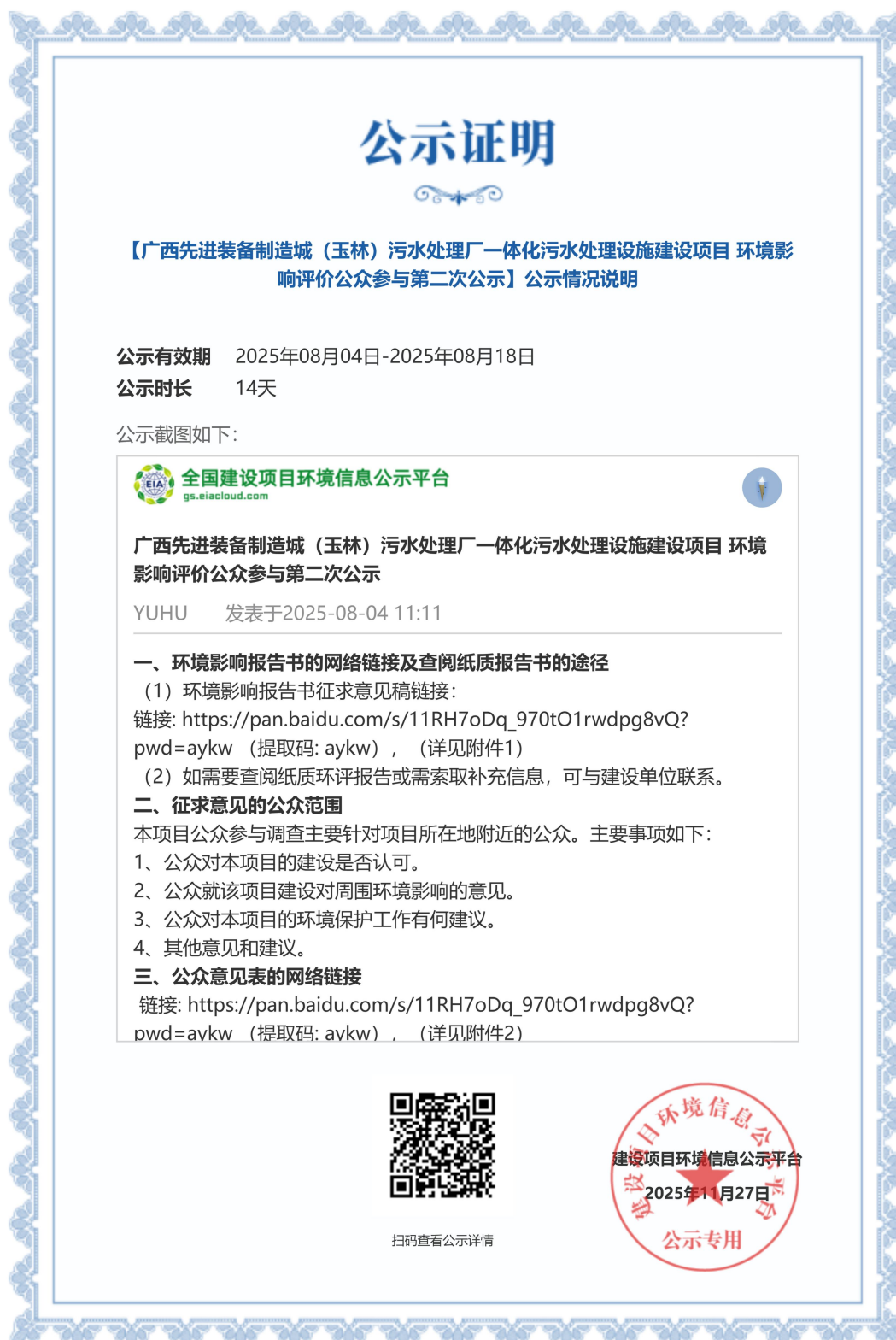
图 3-1 项目环境影响评价第二次公示（网站截图）