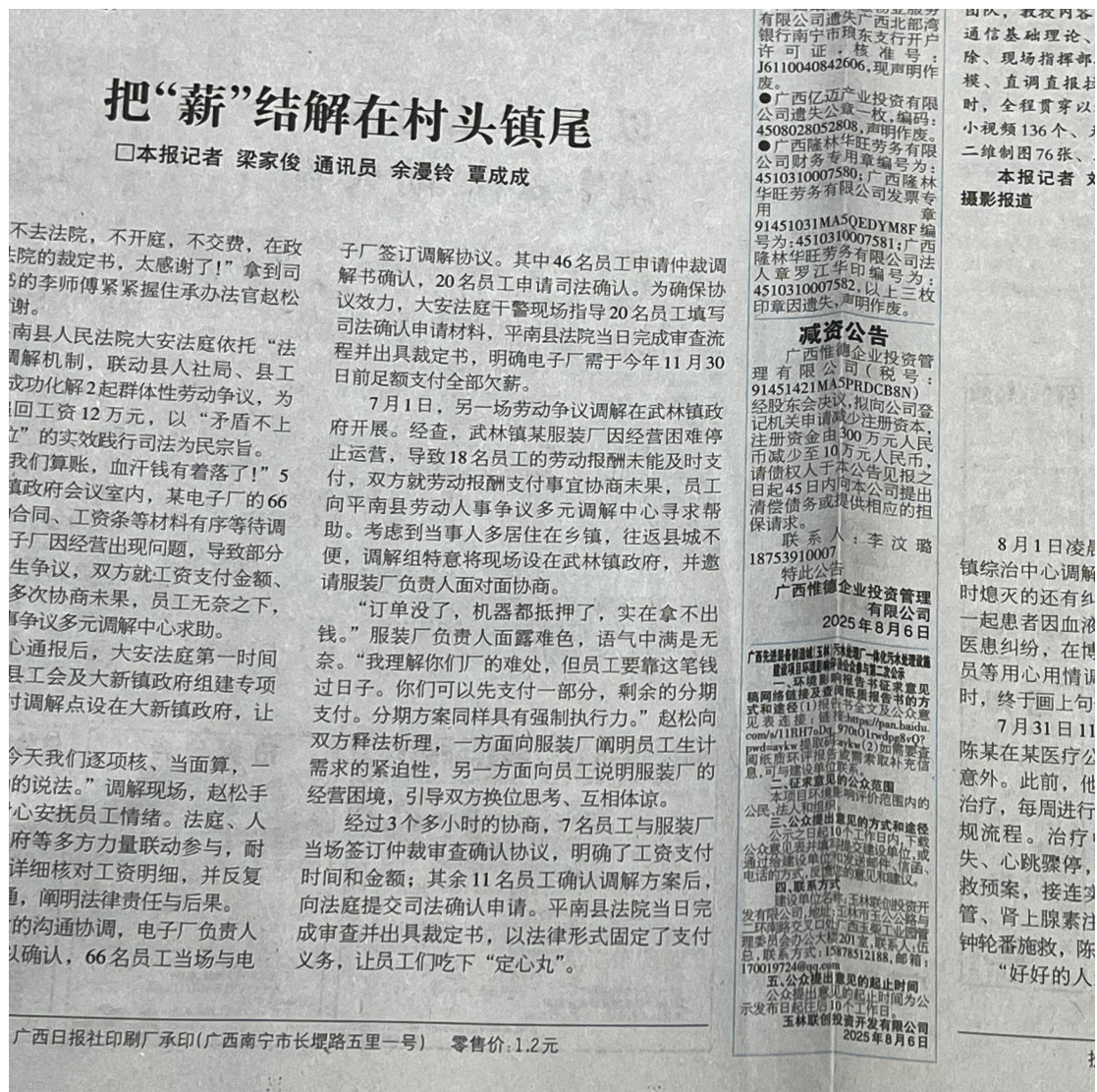
图 3-2 2025 年 8 月 6 日报纸公示图片